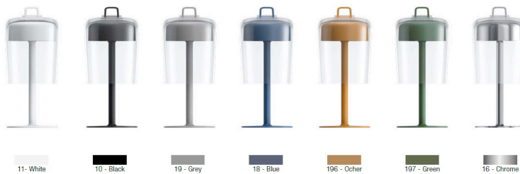
11 - White